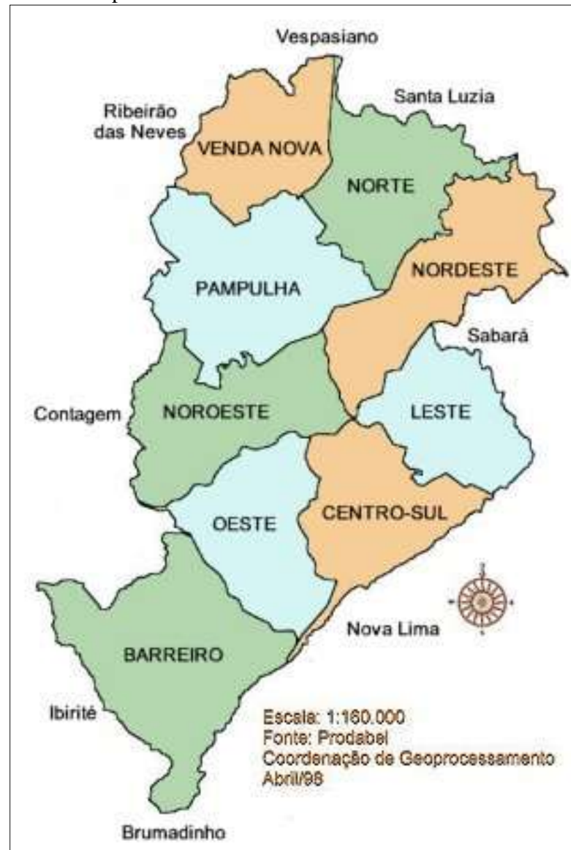
Mapa 1 - Distritos Sanitários de Belo Horizonte