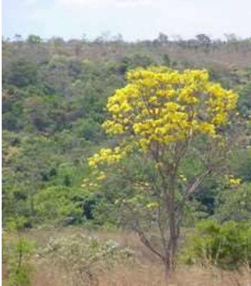
Imagem 1 – Bioma Cerrado